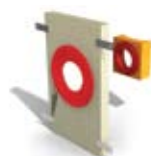
2.17 Turbo bekötő garnitúra