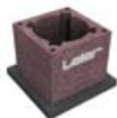
1.1 Könnyűbeton köpenyelem egykürtös kéményhez