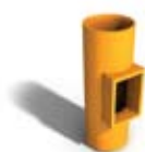
1.5 Samott tisztítóajtó-csatlakozó