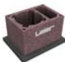
1.2 Könnyűbeton köpenyelem egykürtös kéményhez szellőzővel