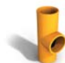
1.7 Samott füstcső-csatlakozó