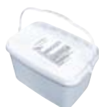
2.15 Béléscső ragasztó