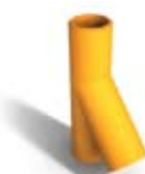
1.9 Samott füstcső-csatlakozó 45°-os