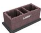
1.3 Könnyűbeton köpenyelem kétkürtös kéményhez szellőzővel